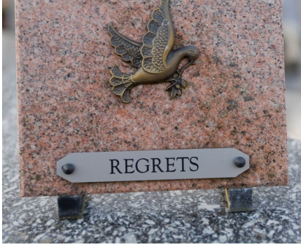
丧葬牌和石头雕刻