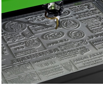
橡皮图章雕刻和切割